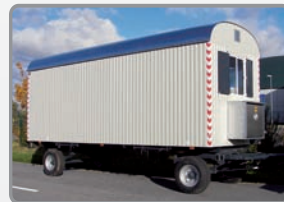
6 m mit Breitreifen