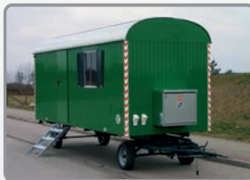
5 m mit Gasheizung