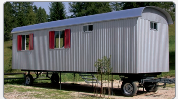
8 m kombinierter Büro- Aufenthalt- u. Sanitärwagen