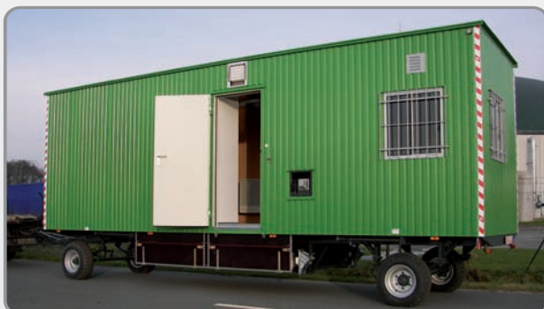
8 m Ausführung mit Flachdach