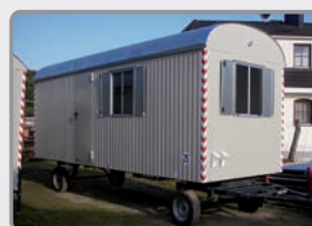
6 m ZA, 25 km/h