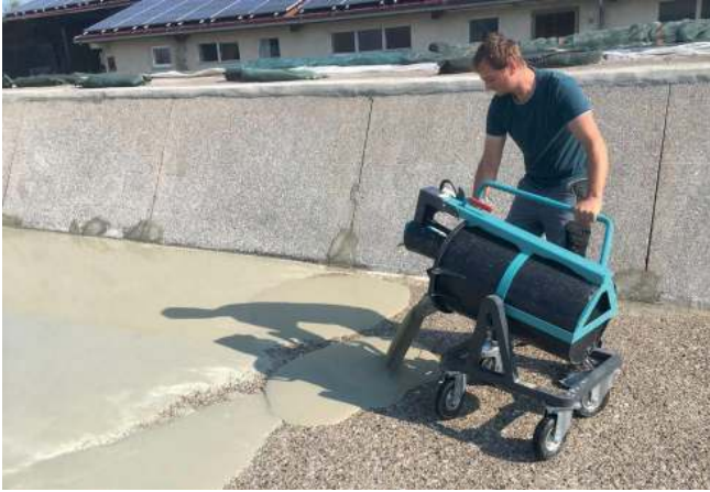
Sonderzubehör: Luftbereifung für unebene Untergründe oder zum Befahren einer Fussbodenheizung.