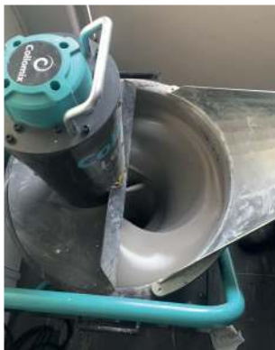
• Mischen •