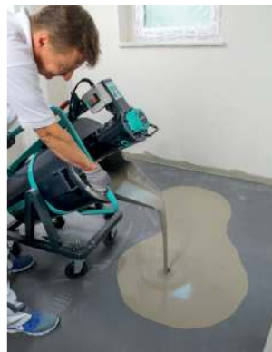
• Ausgießen •