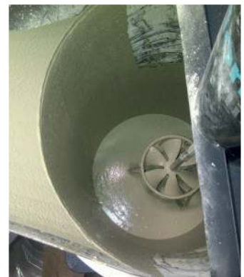
• Einfache Reinigung •