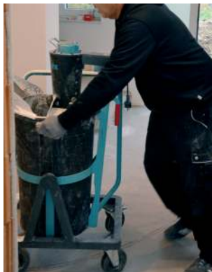
• Transportieren •